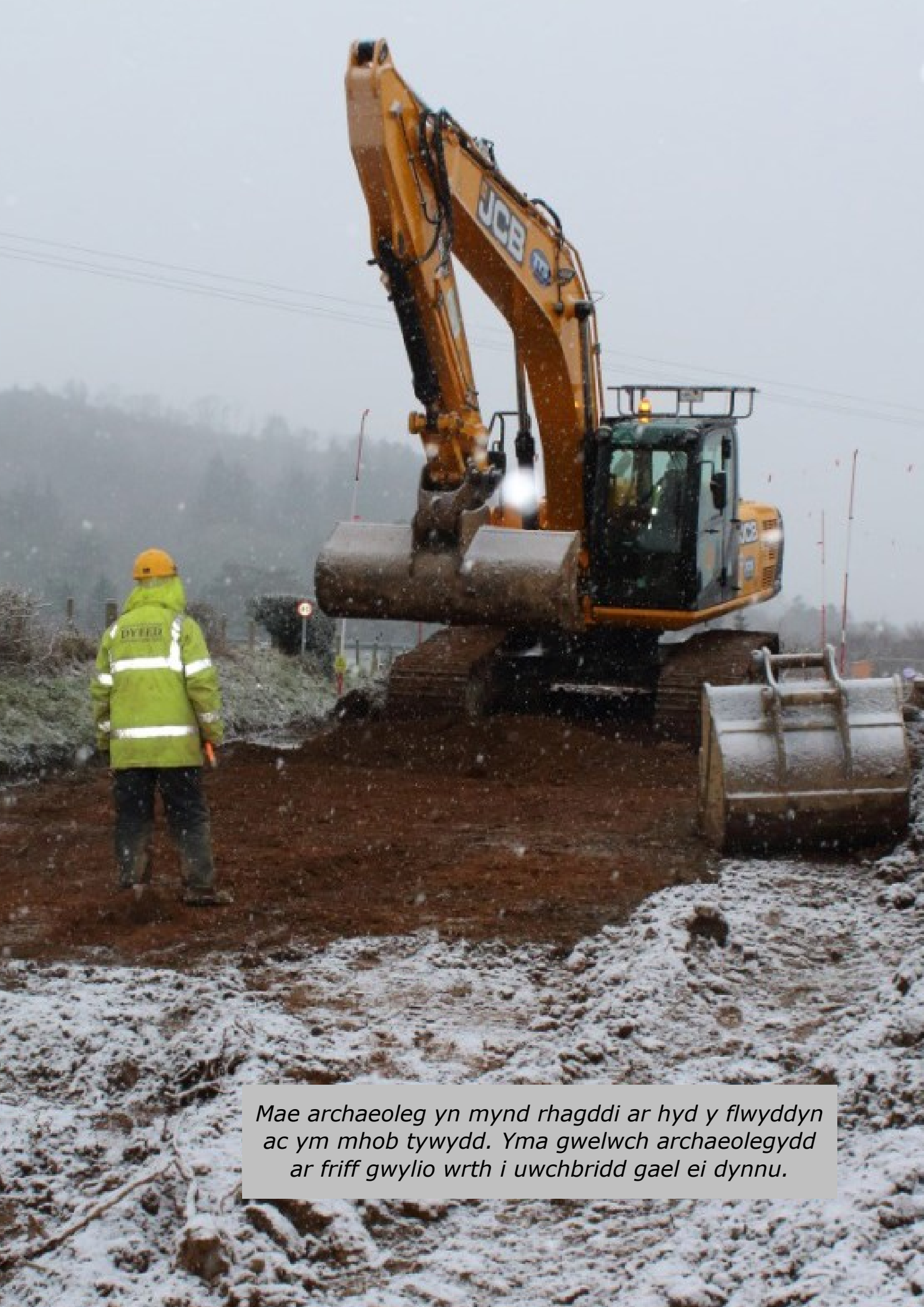
Mae archaeoleg yn mynd rhagddi ar hyd y flwyddyn ac ym mhob tywydd. Yma gwelwch archaeolegydd ar friff gwyllo wrth i uwchbridd gael ei dynnu.