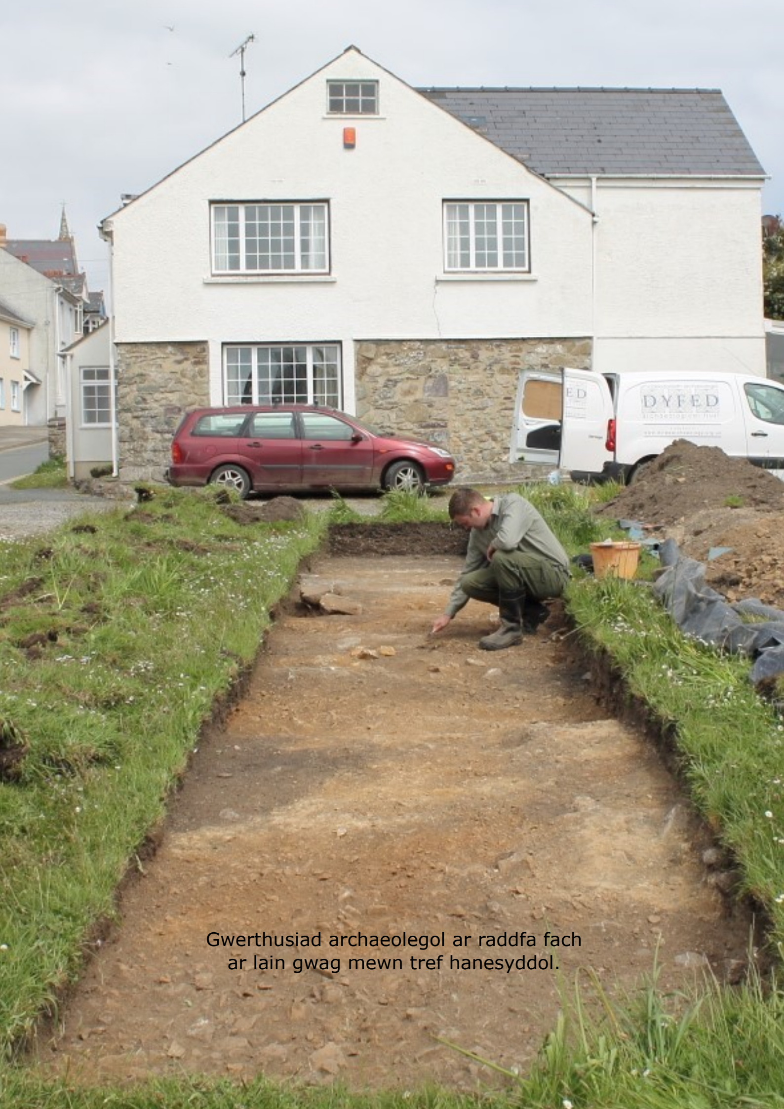
Gwerthusiad archaeolegol ar raddfa fach ar lain gwag mewn tref hanesyddol.