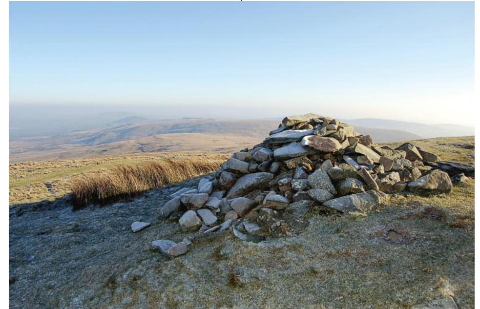
Carnedd cerddwyr yn Foel Feddau

Retracing your steps back to the carpark and keeping the forest on your right, the trail leads you up into the prehistoric landscape of the Preselis. As you cross the ridge eastwards, heading for Foel Drygarn, you are walking the ancient routeway. Although now well off the beaten track, this pathway was once an important thoroughfare.