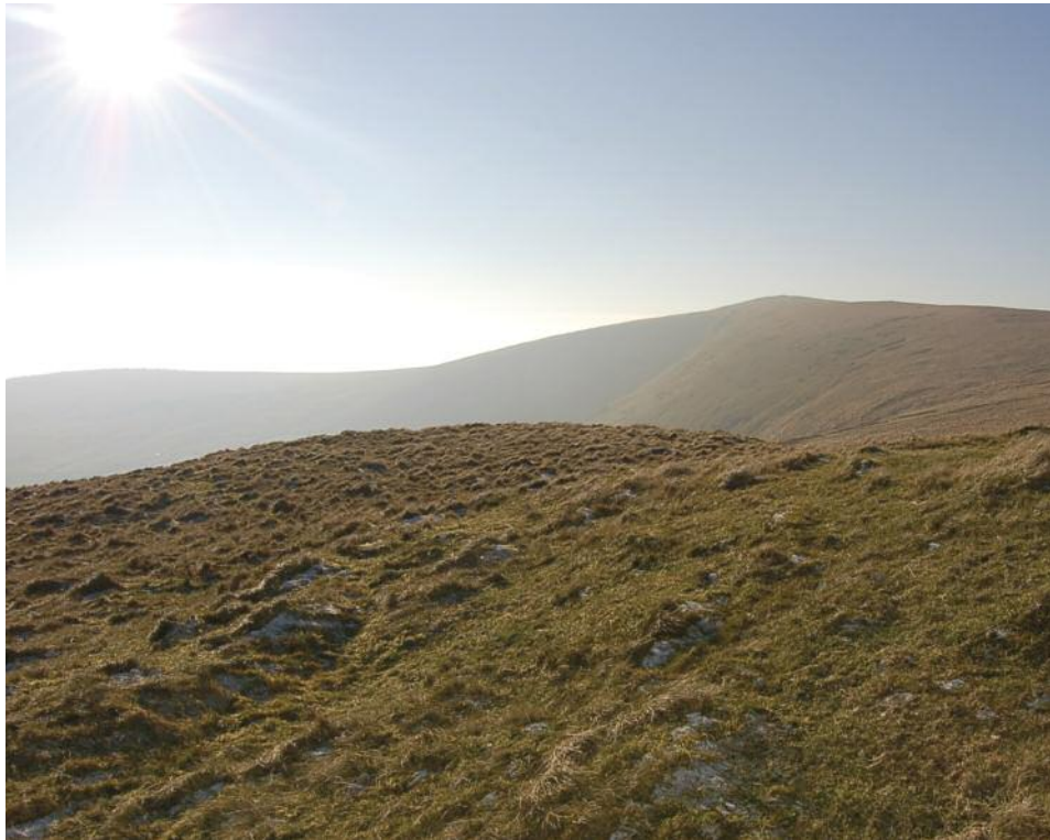
Man Uchaf – Foel Cwmcerwyn