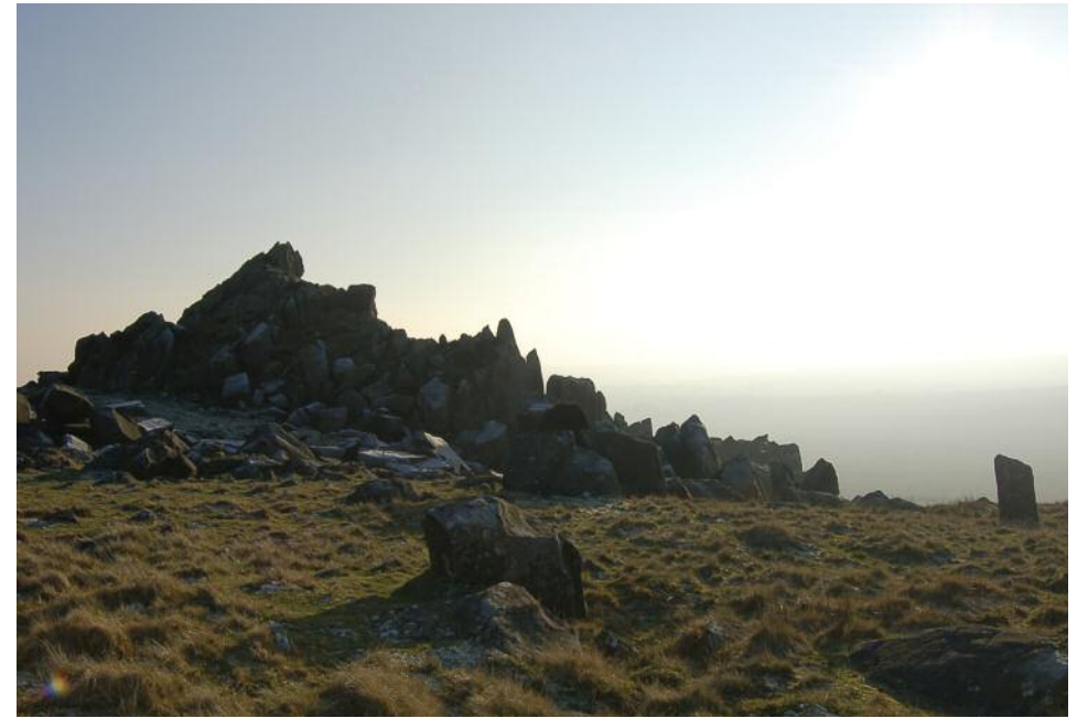
Amlinell greigiog meini glas Carn Menyn

This guide must be used in conjunction with a map which shows the terrain in greater detail, such as the OS Landranger map (145). To be safe in the uplands, make sure you are a competent map-reader, and tell others where you are going.