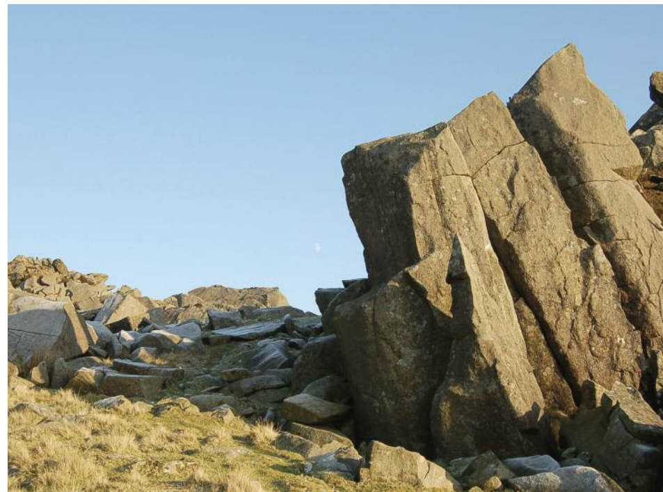
Carn Menyn – y garreg las

Above: The spectacular setting of Bedd Arthur (visible bottom right); Left: A regal resting place - Carn Bica overlooking the stones of Bedd Arthur