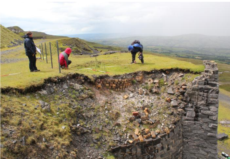
Volunteers on the Calch project recording the top of one of the lime-kilns.

Er mwyn dysgu rhagor am y prosiect CALCH, a sut i gymryd rhan yn y prosiect, cysylltwch â Duncan Schlee yn Ymddiriedolaeth Archaeolegol Dyfed ar d.schlee@dyfedarchaeology.org.uk neu ffoniwch 01558 825984 . Er mwyn dysgu rhagor am ein treftadaeth calch ewch i'n gwefan ar www.calch.org.uk a chadwch olwg am newyddion o ddigwyddiadau CALCH yn 2013. Hefyd, gallwch ein dilyn ar Facebook ac ar Twitter! Chwiliwch am Ymddiriedolaeth Archaeolegol Dyfed.